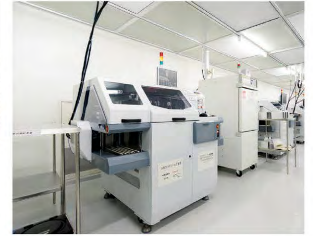
ASIC ダイボンディング装置 ASIC Die bonding machine