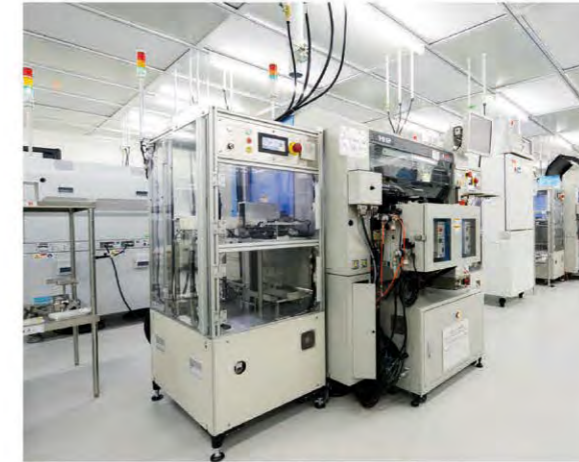
MEMS ケース搭載機 Case installation machine

Hosiden Kyushu has always set its production to match the needs of the market. To meet with requests for mass production on tight deadlines, we have created logical, automated, state-of-the-art assembly lines. With an integrated production system, from planning to manufacturing and testing, we can adapt to constantly changing technological innovations and provide the latest products. We have a wealth of accumulated know-how and a proven history of technological strength, and with our thorough quality assurance system, we will continue to provide the finest of products.