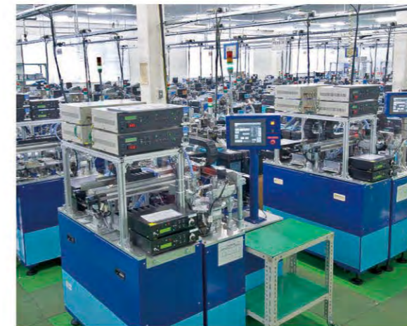
自動感度測定機群 Automatic sensitivity measurement systems