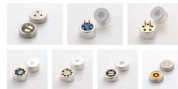
エレクトレットコンデンサーマイクロホン群 Electret Condenser Microphones

電子部品メーカーとしてエレクトロニクス産業を支える ホシデン九州。音響部品の開発製造を出発点とし、時代 のニーズに応えた移動体マイクに代表される、高度化・ 専門化した数々の製品を生み出してきました。すでに 製品群は現在2,000以上のアイテムにのぼり、ユーザー 数も500を超えています。この数字が示す確かな実績。 それを支えてきたのは、ユーザーの要望に対して不可能 をも可能にする「技術開発志向」にあります。