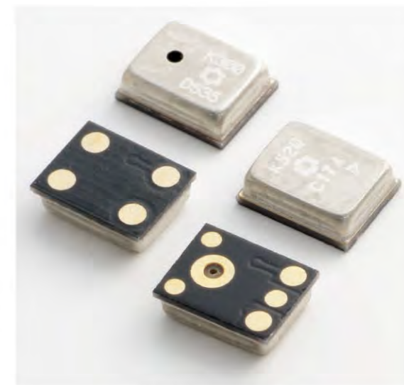
メムマイクロホン群 MEMS (Micro Electro Mechanical System) Microphones

We began mass production and shipping of silicon microphones using MEMS (micro electro mechanical system) technology for use in mobile phones and digital still cameras as a voice-input device for consumer use in January of 2008. This high-performance technology meets customer needs, and can be automatically installed using a mounter, unlike earlier ECMs (electret condenser microphones), and is heat-resistant, making it compatible with reflow solder.