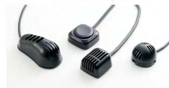
車載用マイクロホン Vehicle-mounted microphone

Hosiden Kyushu supports the electronics industry by being a manufacturer of electronic components. We have created many quality, specialized products, starting with the development of audio components, represented in our mobile microphones that have kept up with the needs of the age. Our product lines have over 2,000 items, and more than 500 customers. These numbers indicate very real results. What has brought us this far is our will to expand our technology to meet with customer desires, and turn the impossible into the possible.