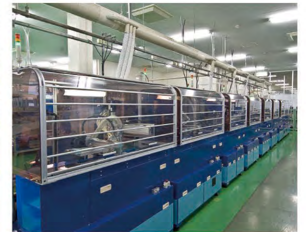
ECM 組立装置 ECM assembly machines