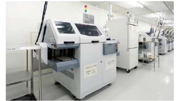
ASIC ダイボンディング装置 ASIC Die bonding machine