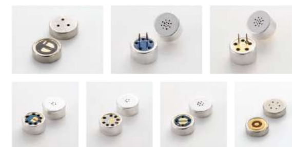
エレクトレットコンデンサーマイクロホン群 Electret Condenser Microphones

Hosiden Kyushu supports the electronics industry by being a manufacturer of electronic components. We have created many quality, specialized products, starting with the development of audio components, represented in our mobile microphones that have kept up with the needs of the age. Our product lines have over 2,000 items, and more than 500 customers. These numbers indicate very real results. What has brought us this far is our will to expand our technology to meet with customer desires, and turn the impossible into the possible.