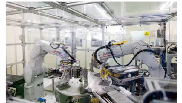
自動アセンブリ装置 Automated assembly machine