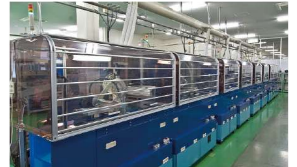
ECM 組立装置 ECM assembly machines