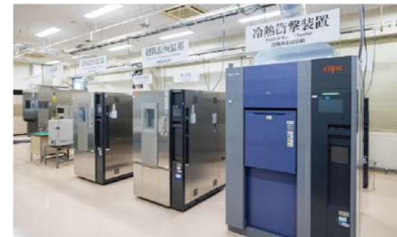
環境試験装置 Environmental Test Chambers