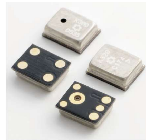
メムスマイクロホン群 MEMS (Micro Electro Mechanical System) Microphones

We began mass production and shipping of silicon microphones using MEMS (micro electro mechanical system) technology for use in mobile phones and digital still cameras as a voice-input device for consumer use in January of 2008. This high-performance technology meets customer needs, and can be automatically installed using a mounter, unlike earlier ECMs (electret condenser microphones), and is heat-resistant, making it compatible with reflow solder.