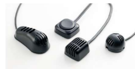
車載用マイクロホン Vehicle-mounted microphone