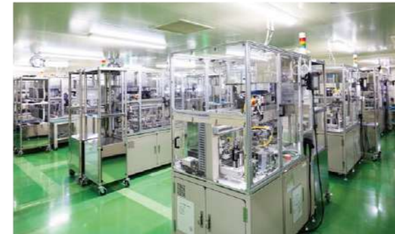
自動感度測定機群 Automatic sensitivity measurement systems