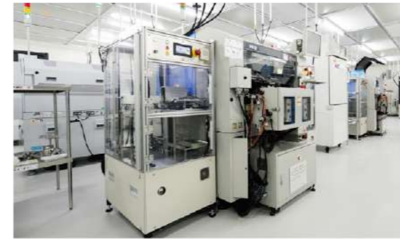
MEMS ケース搭載機 Case installation machine

Hosiden Kyushu has always set its production to match the needs of the market. To meet with requests for mass production on tight deadlines, we have created logical, automated, state-of-the-art assembly lines. With an integrated production system, from planning to manufacturing and testing, we can adapt to constantly changing technological innovations and provide the latest products. We have a wealth of accumulated know-how and a proven history of technological strength, and with our thorough quality assurance system, we will continue to provide the finest of products.